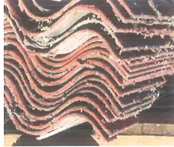
4 Asbestzementabfall offen

Offenes Material darf auf der Deponie nicht gebrochen, zerschlagen oder verdichtet werden.