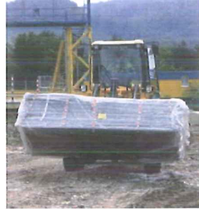
3 Festgebundener Asbest in Säcken oder mit Kunststoffolie staubdicht verpackt