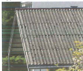
1 Asbestzement: Dachplatten

Typische Beispiele von festgebundenem Asbest: