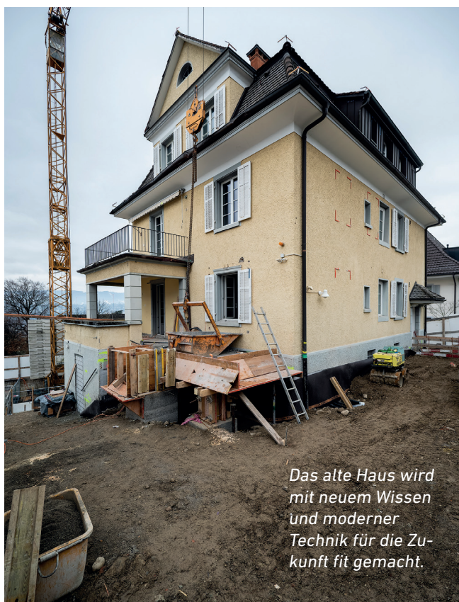
Das alte Haus wird mit neuem Wissen und moderner Technik für die Zukunft fit gemacht.