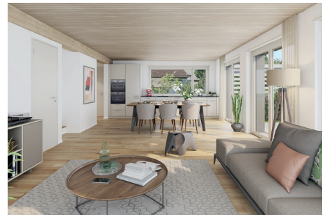
... und bietet in allen vier Einheiten viel Privatsphäre.